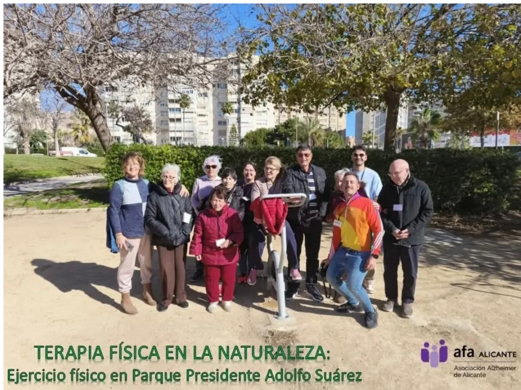
TERAPIA FÍSICA EN LA NATURALEZA: Ejercicio físico en Parque Presidente Adolfo Suárez